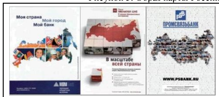
Рисунок 5. Образ карты России в печатной рекламе.

Другое предназначение карты в постмодернистской рекламе – демонстрация открытого плюрального мира, в котором, по мысли Е.Н. Ежовой, «потенциально присутствует гибкий выбор равнозначных вариативных возможностей» [2, с. 121]. И рекламируемый товар становится именно тем средством, которое позволяет реализовать этот потенциал. Наглядное представление данного свойства ризомы мы наблюдаем в печатной рекламе индийского оператора сотовой связи «Onida Mobiles», выпущенной в феврале 2011 года креативной группой рекламного агентства «McCann Worldgroup» (см. рисунок 6). У героя рекламы – водителя автомобиля, мотоцикла или скутера – сложный выбор: отказаться от телефонного разговора с родными или друзьями, потому что это мешает безопасному движению на дороге, или продолжать общение, подвергая себя серьезной опасности попадания в аварию. На помощь горе-водителю приходят самые близкие и надежные люди – мама, любимая девушка, начальник, которые настоятельно рекомендуют воспользоваться