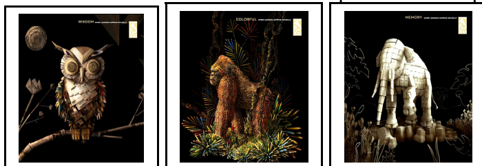
Рисунок 4. Принцип незначашего разрыва в рекламе зоопарка Лос-Анджелеса.

На плакатах изображены животные – обитатели городского зоопарка, но они – не абсолютная копия своих представителей животного мира. Сова, олицетворяющая мудрость, выполнена из страниц известных американских журналов и газет, горилла, в реальности имеющая яркую окраску, на постере сделана из цветных карандашей, а слон, символизирующий память, вообще собран из ненужных картонных коробок. Слоган компании – «Здесь все происходит по-настоящему!» – актуализирует главную цель рекламы – заботу о редких представителях фауны. Таким образом, на первый взгляд, обычные материальные предметы (карандаши, использованные газеты, журналы и коробки), служащие в реальности лишь для чтения, рисования и упаковывания, в ризомной постмодернистской рекламе приобретают другое назначение, одушевляются и наделяются глубоким смыслом, заставляя целевую аудиторию обращать внимание на разнообразность жизни, ее многоплановость, вариативность, т.е. отсутствие конца в развитии идей, мыслей, чувств – незначашего разрыва.