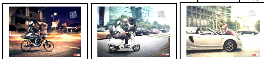
Рисунок 6. Принцип картографии ризомы в рекламе бренда «Onida», Индия.

Таким образом, ризома являясь фундаментальной установкой постмодернизма, активно внедряется и реализуется в рекламном медиaprостранстве. Принципы ризомы (связь и гетерогенность, множественность, незначащий разрыв, картография и декалькомания) находят свое отражение в рекламных постерах, плакатах, роликах, а главное – они способствуют открытости и незамкнутости рекламного мира, увеличению доли креатива в рекламе, плюральной интерпретации всего рекламного пространства.