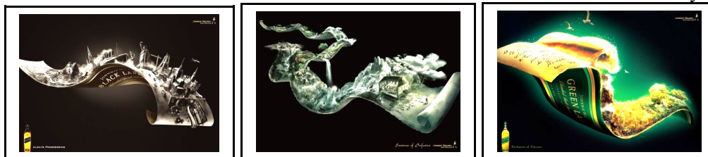
Рисунок 3. Принцип связи и гетерогенности ризомы в рекламе алкогольного напитка «Johnnie Walker Whisky», Тайвань.

На первом постере на обертке от виски поместились Эйфелева башня из Парижа, статуя Свободы из Нью-Йорка, вулкан Килиманджаро из Центральной Африки, трагично известный на весь мир «Титаник», бороздящий воды Атлантики; на втором – рядом расположены высочайшие водопады, непроходимые леса, живописные горы, безлюдная пустыня, густонаселенный город, на третьем – друг с другом соседствуют величественные морские волны, желтеющие поля и леса. Такое смешение внутри одной рекламы разных природных зон, достопримечательностей, географических объектов из самых отдаленных уголков планеты возможно лишь благодаря ризомной децентрализации, едва уловимой связи, основанной на других принципах и существующей в иных временных измерениях.